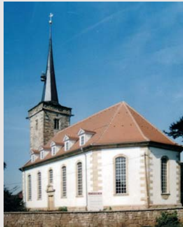
Kirchenschiff und Turm