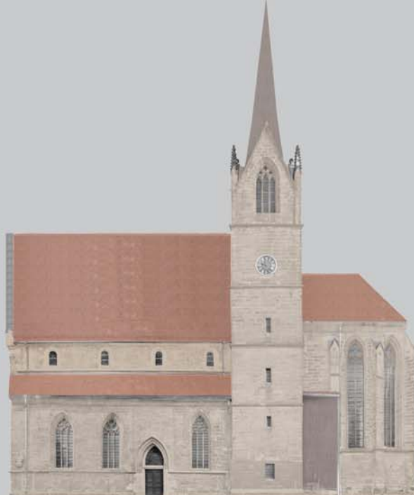
Ansicht von Süden - Planung

Die Kaufmannskirche zählt zu den bedeutenden Kulturdenkmälern der Landeshauptstadt Erfurt. Sie wurde 1248 erstmals urkundlich erwähnt. Ihre große stadtgeschichtliche Bedeutung ist unter anderem begründet in einer Predigt Luthers und der Nutzung als Hauskirche durch die Erfurter Bach-Familien.